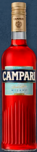
Campari® 25 % vol., 0,7-l-Flasche