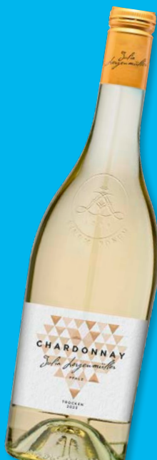
Julia Lergenmüller Chardonnay QbA Pfalz, trocken, 0,75-l-Flasche