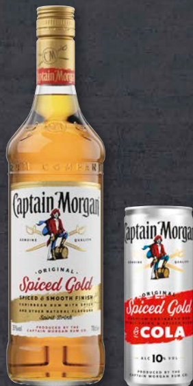
Captain Morgan™ Versch. Sorten, z. B. White Rum Mojito, 10 % vol., 0,25-l-Dose, zzgl. Pfand 0.25