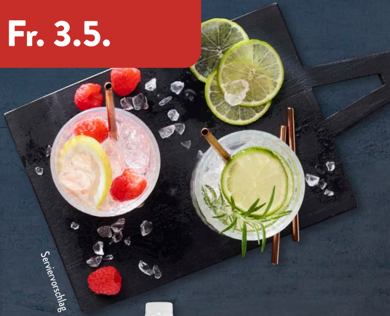
Auch als 6er-Pack erhältlich