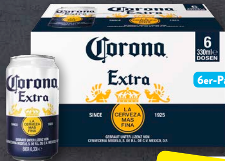
Corona® Extra 6 x 0,33-l-Dose, zzgl. Pfand 6 x 0.25 = 1.50