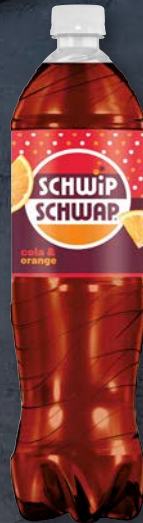
Schwip Schwap® Koffeinhaltiges Erfrischungsgetränk, Original oder Zero (enthält Süßungsmittel), je 1,25-l-Flasche