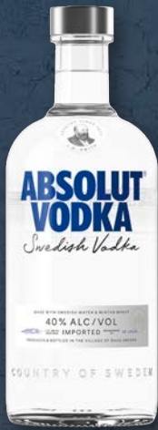
Absolut Vodka 40 % vol., 0,7-l-Flasche